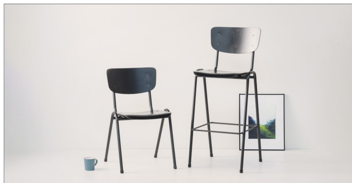
Stuhl 402 lackiert und 404 gepolstert

Die Programmserie 400 wurde mit einem Barhocker, der auch in gepolsterter Ausführung erhältlich ist, vervollständigt.