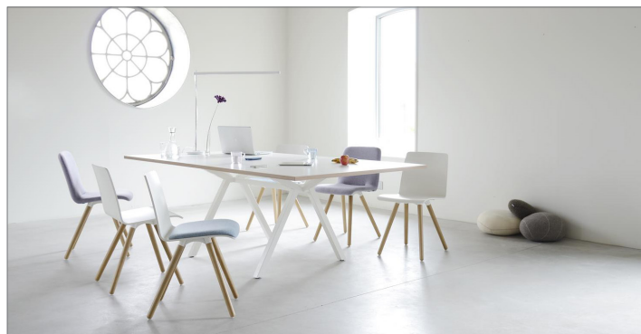
Pit-HF20 mit Tisch VPAX

Jede Einrichtung, ob betrieblich oder privat, braucht ein bisschen Pep. Und genau den bringt unsere neue Stuhlserie Pit! Die Sitzschale und die Stuhlbeine sind aus nachhaltig produziertem Holz. Bei der gepolsterten Version stehen diverse nachhaltige Stoffe zur Auswahl. Kurzum: Pit ist die moderne Sitzlösung.