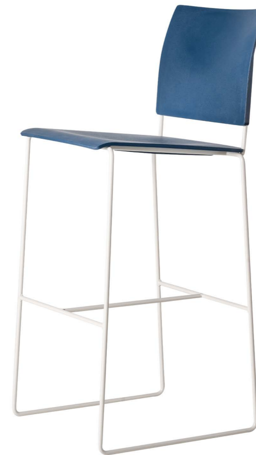
Blue Finn High