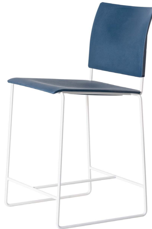
Blue Finn Medium