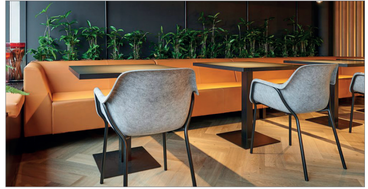
Elements mit Stuhl Felt und Tisch T60

Sitzelemente mit endlosen Möglichkeiten. Elements ist die ideale Lösung für jedes Geschäfts-, Gastronomie- oder Bildungsumfeld. Das modulare Sitzmöbelprogramm umfasst sowohl ein- als auch zweisitzige Sofas, die mit geradem Rücken oder als Eckelement mit Armlehne erhältlich sind. Die beiden separat erhältlichen Powerunits erfüllen alle Ansprüche, die eine Arbeitsumgebung stellt. Elements ist zu 95 % recycelbar und besteht aus einer umweltfreundlichen Holzkonstruktion mit Materialien aus verantwortlichen, zertifizierten Quellen.