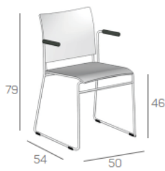
FINNDF10BF met armlegger

zitting en rug kunststof draadframe staal